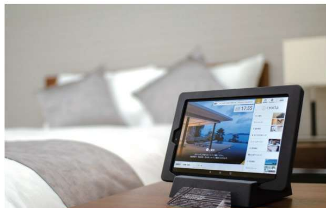
客室タブレット「crotta(クロッタ)」